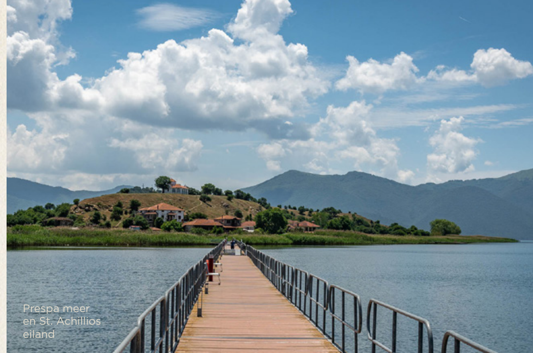
Prespa meer en St. Achillios eiland

Van 927 tot 1912 (toen het werd bevrijd tijdens de Balkanoorlogen) viel de stad achtereenvolgens in handen van de Noormannen, Albanese, Bulgaren en Ottomanen, waardoor ze een multicultureel karakter heeft gekregen. Tegenwoordig telt de stad ongeveer 17.000 inwoners.