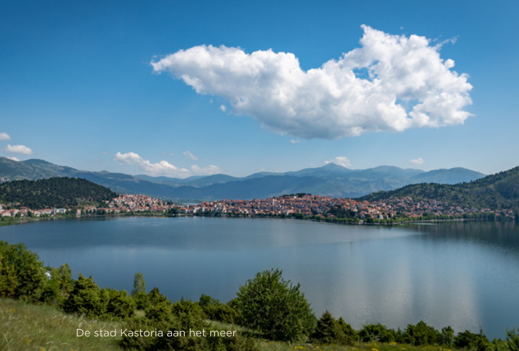
De stad Kastoria aan het meer

Van een afstand lijkt Kastoria op een schilderij van een impressionist. Wanneer je dichterbij komt zie je de indrukwekkende aristocratische herenhuizen aan het meer, omringd door groepjes hoge bomen. Het stadje is bezaaid met schitterende Byzantijnse kerken. Kastoria kent sinds 5000 voor Christus een voortdurende menselijke aanwezigheid. De moderne stad werd gesticht door keizer Justinianus. Men denkt dat de naam afkomstig is van “Kastro” (kasteel).