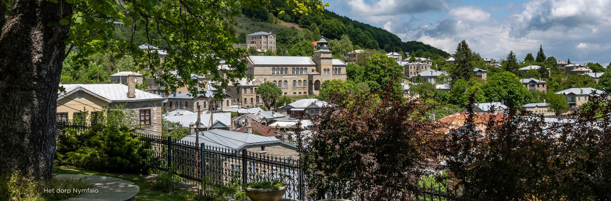
Het dorp Nymfaio